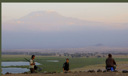
Namibie : La traversée des déserts 26'