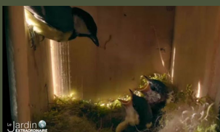
Nos nichoirs extraordinaires 26'