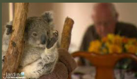
Australie : l'île des kangourous 26'