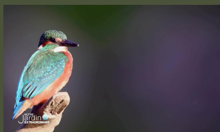
Notre jardin extraordinaire #5 : Un été chez nous 26'