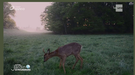
Notre jardin extraordinaire #4 26'