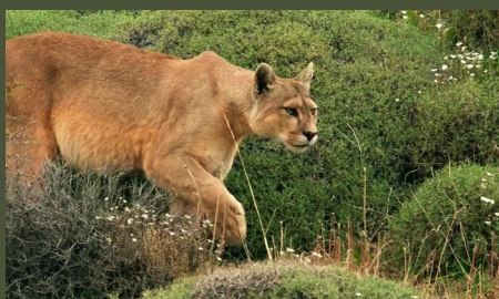
Patagonie : La piste du puma 26'