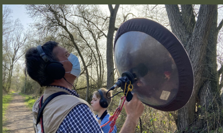
Le son des oiseaux d'Harchies 26'