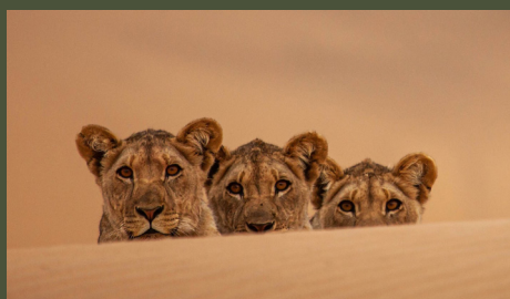
Namibie, la reine lionne 26'