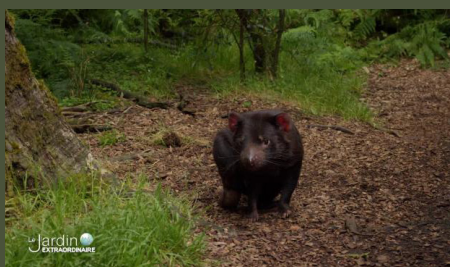
Tasmanie : le territoire des diables 26'