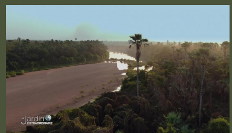
Sur les pistes du Niokolo Koba 26'