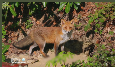
Notre jardin extraordinaire #3 26'