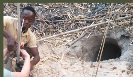
Sénégal : les mystérieux terriers du Niokolo-Koba 26'

► ÉPISODE BONUS : Notre jardin, la faune autour des points d'eau belges