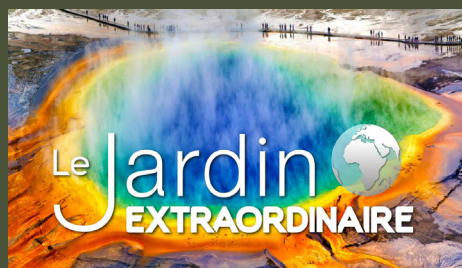
Yellowstone : De neiges et de fumée 26'