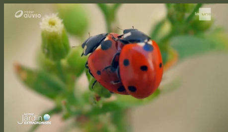
Notre jardin extraordinaire #2 26'