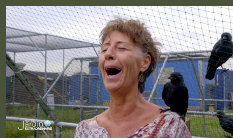
Nos soigneurs extraordinaires : Au secours de la faune sauvage 26'