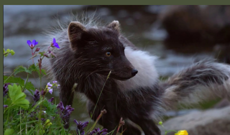
Islande : sur les traces du renard polaire 26'