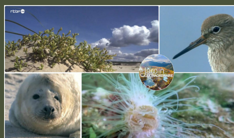
Sur la plage, la vie 26'