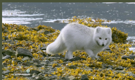
Toundra : l'ours, le renard et le bruant 26'