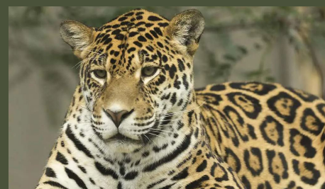
Guatemala : Sur la piste du jaguar 26'

Achat de programmes et de contenus digitaux : sales@rtbf.be Achat d'extraits ou d'archives RTBF : sales@sonuma.be