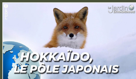
Hokkaïdo, le pôle japonais 26'