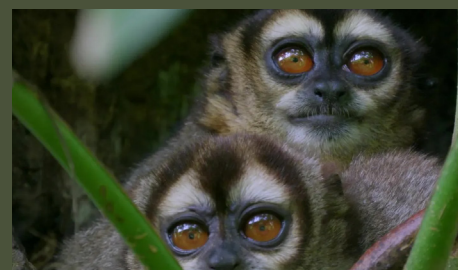
Colombie, coeur sauvage 26'