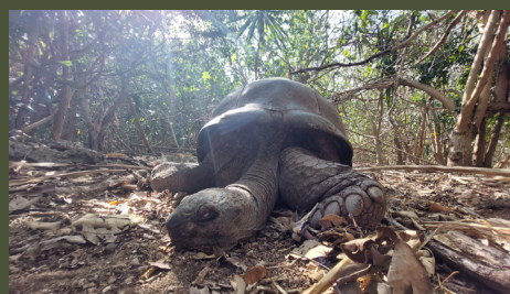
Île Maurice : Le réveil de la nature 26'